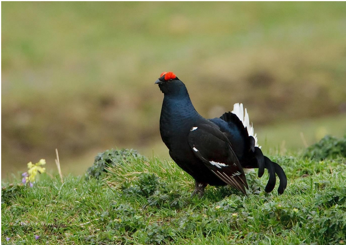
Birkhahn ( Lyrurus tetrix )

Sowohl Birk- als auch Auerhühner zählen zu den Raufußhühnern, deren Beine und Füße größtenteils befiedert sind und deren Nasenlöcher ebenfalls durch Federn geschützt sind. Damit sind sie an die rauen Bedingungen der Alpen optimal angepasst. Beide Arten meiden den geschlossenen Bergwald. Das Auerhuhn - fast truthahngroß - hält sich bevorzugt an der Grenze zwischen Baumbeständen und sonnigen Waldlichtungen auf. Das wesentlich kleinere Birkhuhn lebt an der Waldgrenze. Beide brauchen reich strukturierte Wälder. Für das zahlenmäßig weit geringer vertretende Auerwild wurden in den Schutzgebieten Programme entwickelt, um Lebensräume zu schaffen und zerstückelte Reviere wieder zu vernetzen. Beiden, in Mitteleuropa rückläufigen Arten, gilt der Alpenraum als wichtiges Rückzugsgebiet.