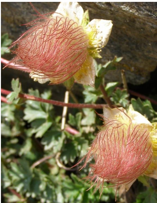
Gletscher-Petersbart ( Geum reptans )

Der größten Vielfalt begegnen wir an den Übergängen zwischen dem Silikatsockel und dem aufliegenden Kalkgestein. So präsentiert sich dieser geologische „Reisverschluss“ besonders eindrucksvoll am Seejöchl. Ein Schritt, und wir treten von einstigem Meereskalk auf den Sockel der ehemals afrikanischen Kontinentalplatte. Hier kalkliebende Pflanzen wie Clusius-Enzian, Steinröschen und Silberwurz, dort – etwa mit Gletscher-Petersbart und Berghauswurz - Silikatbesiedler.