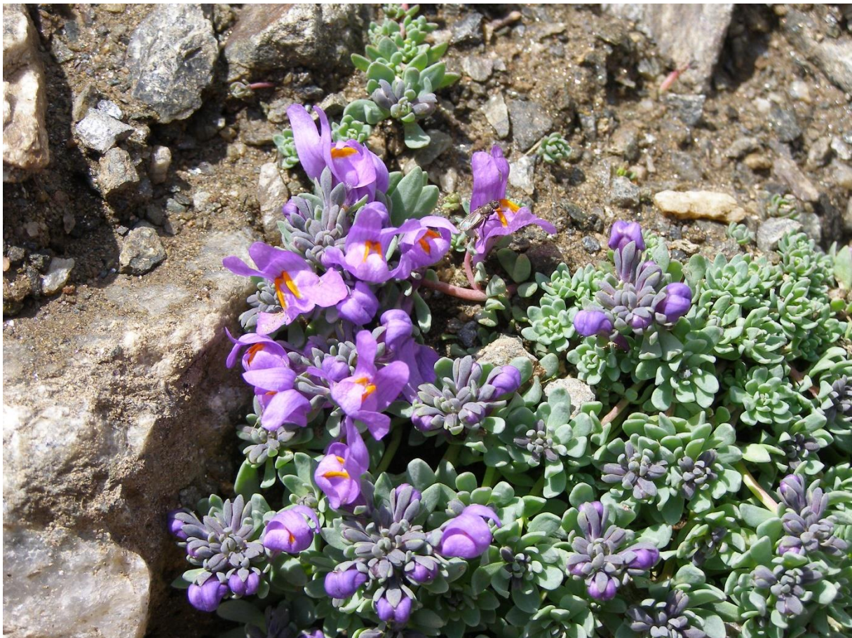
Alpen-Leinkraut ( Linaria alpina )

Die Vertreter beider Gruppen begegnen den Gegebenheiten des Untergrunds mit unterschiedlichen Strategien. Im Kalk verschwindet das Regenwasser schnell. Die Pflanzen müssen demnach langes Wurzelwerk ausbilden, um ans kostbare Nass zu gelangen. Extremstandorte bilden trockene Kalkschuttrinnen, die von Alpen-Aurikeln und Alpen-Leinkraut besiedelt werden. Silikat ist wesentlich spendabler mit Wasser, dafür aber geiziger mit Nährstoffen. Diese sind hier relativ fest gebunden.