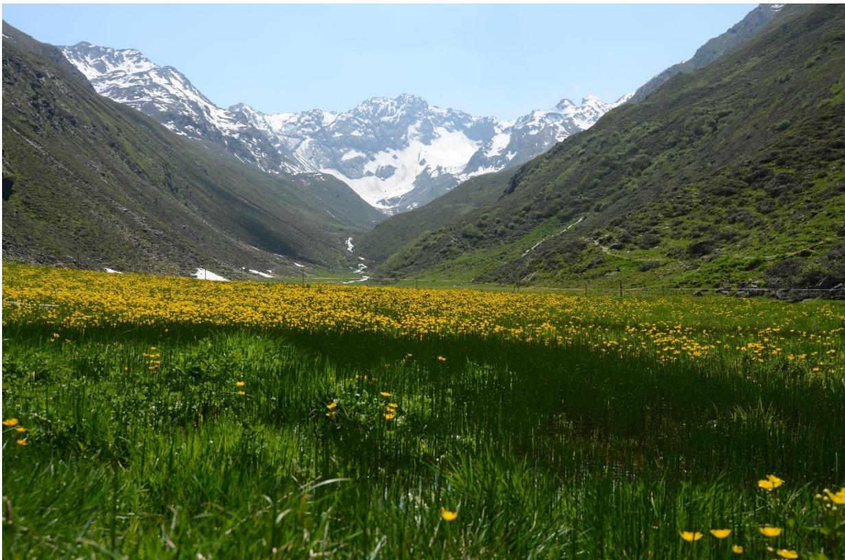
Moor bei der Seealm

Im westlichen Teil des Ruhegebiets fließt der Fotscherbach durchs gleichnamige Tal. Samt seiner Seitenbäche und einem fünf Meter breiten angrenzenden Geländestreifen ist er 1983 vom Fotscher Ferner bis zum Alpengasthof Bergheim zum Naturdenkmal erklärt worden. Sein Verlauf durchfließt unterschiedliche Vegetationseinheiten, vom montanen Schluchtwald bis ins Hochgebirge. Im flachen Gebiet der Seealm haben sich Moorflächen gebildet, die er in breiten Mäandern durchfließt. Dort hat sich eine reiche Feuchtgebietsflora entwickelt. Vor allem für die gefährdeten Amphibien bietet der Bach hier einen idealen Lebensraum.