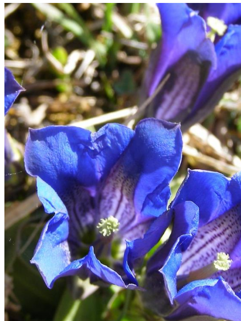
Clusius Enzian ( Gentiana clusii )